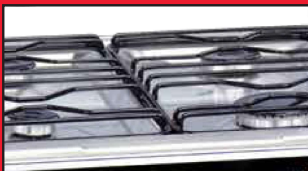
Cubierta Acero Inoxidable